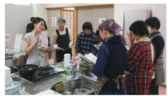
道志ポークの串焼き