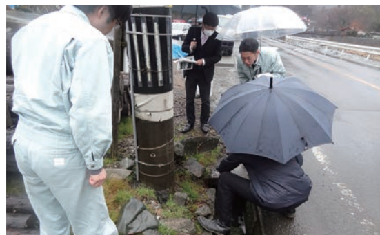
(上) 道志村通学路安全推進協議会 (下) 通学路の合同安全点検