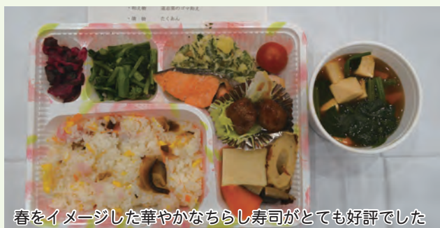
春をイメージした華やかなちらし寿司がとても好評でした