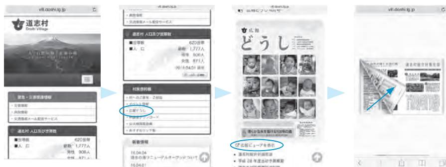
村役場 HP トップ画面下部 「広報どうし」をタッチ