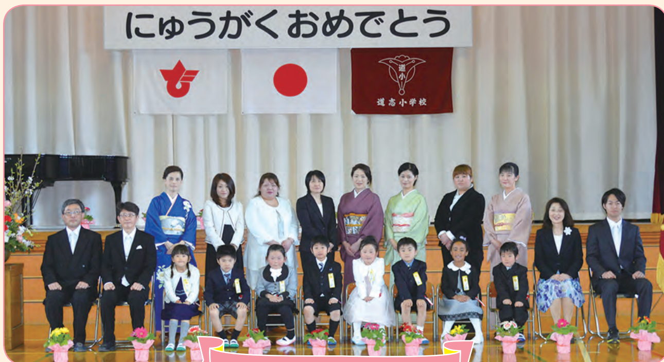
道志小学校入学式

桜のつぼみが膨らみ、春の日差しが差し込む4月6日、多くの来賓の皆様や保護者のご臨席のもと、道志小学校、道志中学校の入学式が挙行されました。