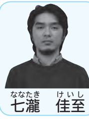
な な た 七 瀧 け い し 佳 至