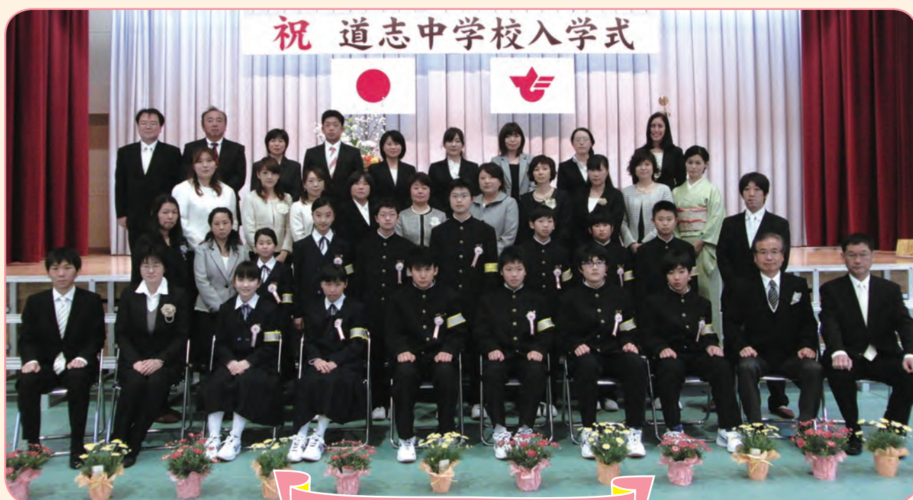
道志中学校入学式