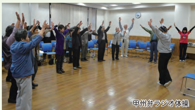
甲州弁ラジオ体操

昼食は、食育の一環として地産地消をテーマに、道志産のタンパク質・カルシウムたっぷりの食材でお弁当をいただきました。午後は、駐在所の伊奈巡査部長よりオレオレ詐欺に関する注意喚起をしていただきました。また、参加者の方に自己紹介をしていただき、元気な声を聴いた後、大正琴、日本舞踊、浜ちゃん体操の発表や脳神経に刺激を与える脳トレーニング、カラオケなどで盛り上がり心身ともに刺激を受け、楽しい時間を過ごしました。