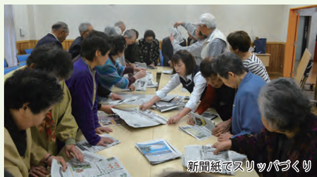
新聞紙でスリッパづくり