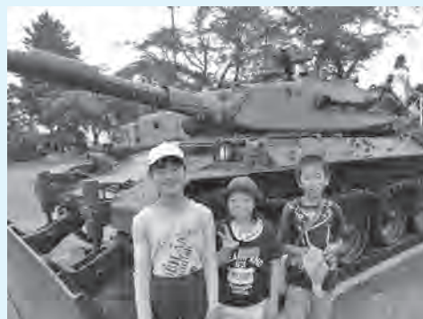
戦車の 大きさに 圧倒！