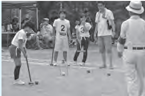
第2ゲート 付近の戦いが 熱い！