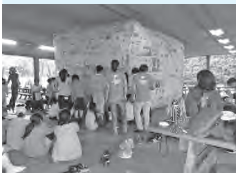
力を合わせて 作りました