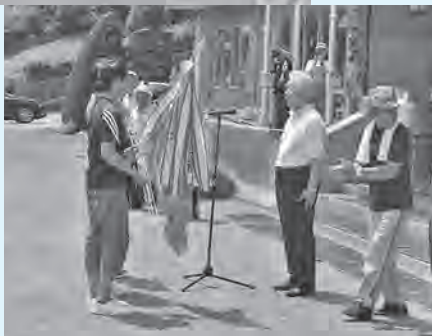
優勝おめでとう ございます