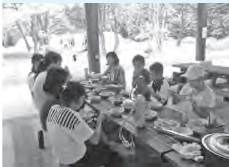
準備から片付けまで 全部自分たちで おこないます