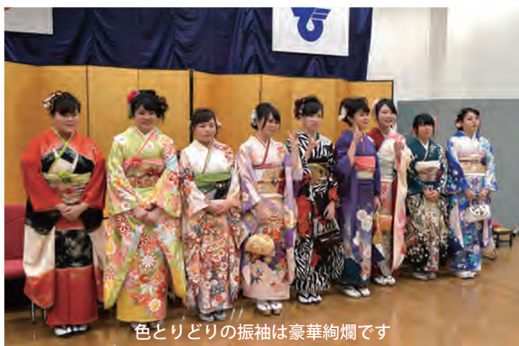
色とりどりの振袖は豪華絢爛です

今までの二十年を振り返ってみると本当にあっという間でした。たくさんの人に支えられてきました。何不自由なく学校に通い、好きなことをさせてもらいました。そして、私がいつも思うことは、家族や友達、先生など周りの人に恵まれているということです。助けられてばかりで感謝しています。現在は、大学に通うため、一人暮らしをしています。両親をはじめ、まだまだお世話になることが多いです。これからは大人としての自覚を持ち、社会に貢献できる自立した大人を目指し、お世話になった人への恩返しをしたいです。 〈近況〉大妻女子大学に在学中です。授業や資格取得に向けた勉強、サークル活動、アルバイトなどに励んでいます。