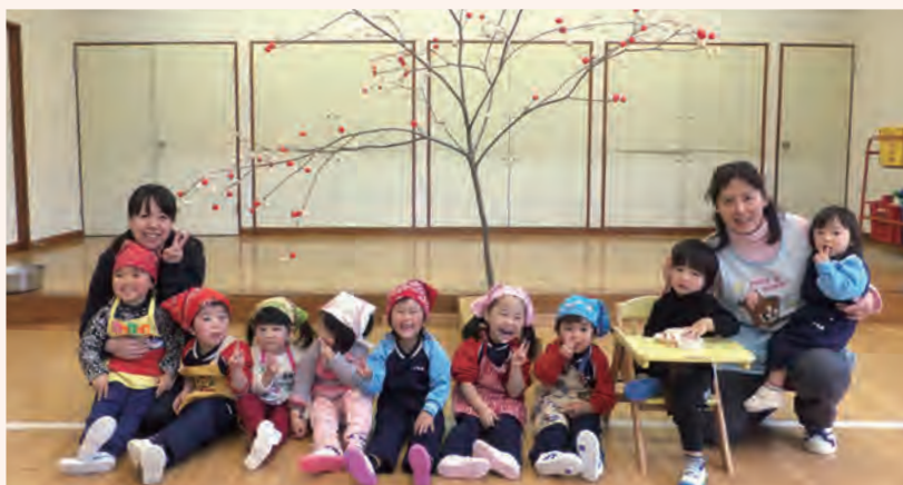
元気で過ごせますように… 願いをこめて