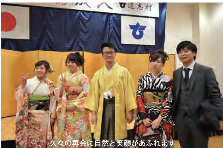
久々の再会に自然と笑顔があふれます

二十歳を迎えて、大人としての行動、ふるまいなど日々の生活の中で意識することが増えました。まだまだ未熟な私ですが、常に成長したいという気持ちを忘れず努力していき、柔軟性のある魅力的な大人になりたいです。道志村で育った事に誇りを持ち故郷を愛することを忘れず、世に出ていき、いつか恩返しのできたらいいと思っています。家族や友人に感謝の気持ちを忘れずにこれからがんばっていきたいです。