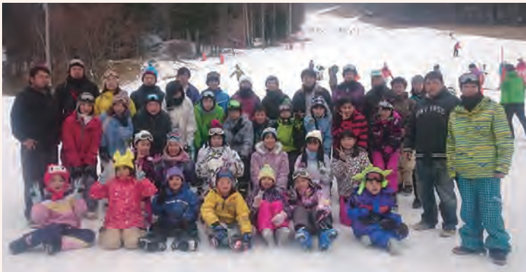
ウィンタースポーツ大好き！

1月3日（火）に道志村体育協会主催のスキー教室を「富士見パノラマスキー場」で開催しました。今年も42名の参加と例年通り多くの住民のみなさまにご参加いただき、大変にぎやかなスキー教室となりました。