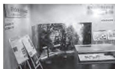
横浜に行かれた際は足をお運びください！