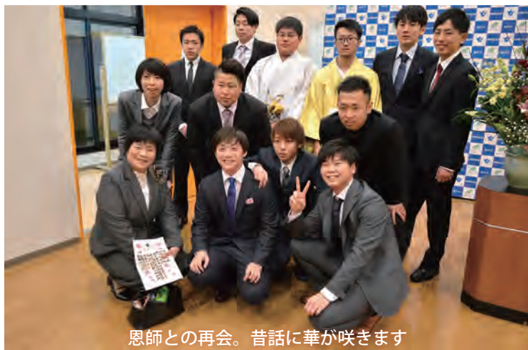
恩師との再会。昔話に華が咲きます

僕は高校を卒業し、葦崎にある会社へ入社し、今は切削機などを組み立てる工程作業に付いています。高校時代に相撲部に所属していて、今も後輩の指導や自分自身も国体に出られるよう練習に励んでいます。今は自分ができることを一生懸命がんばろうと思いません。将来的には、役職に付けるようになりたいと思っています。 〈近況〉仕事が忙しく、毎日残業をしています。プライベートでは、相撲の練習に励んでいます。大変ですが、充実しています。