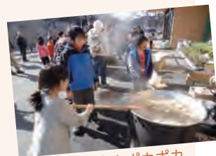
身体も心もポカポカ

「団子さし」は、家内安全・一家繁栄・五穀豊穡を祈る行事で、村では、毎年、郷土史を語る会主催で「どんど焼き」と合わせて開催しています。今年は雪の影響もあり、「団子さし」のみの開催となりましたが、多くのみなさまにご参加いただき、寒空の下にぎやかな会になりました。大鍋でつくった豚汁も大好評でした。