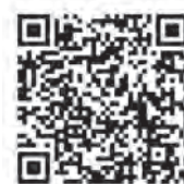
LINE 道志村子育て世代包括支援センター(公式)

道志村子育て世代包括支援センターの公式LINEアカウントを開設しました。こちらでは、道志村の子育て情報を随時発信していきます。個別での相談も可能です。ぜひ、ご活用ください。QRコードをお手持ちのスマートフォン等で読み込んで登録してください。