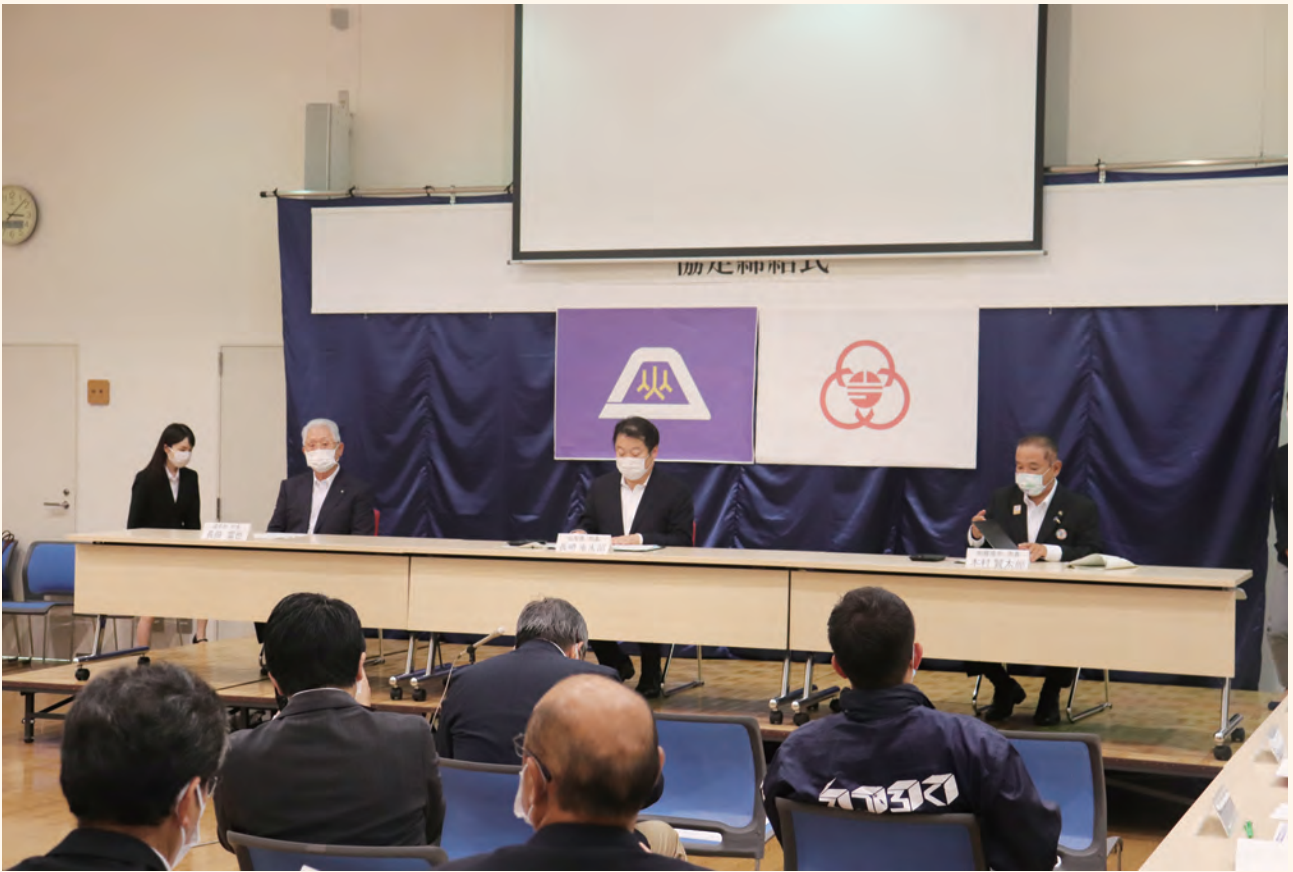
左から、長田富也道志村長、長崎幸太郎山梨県知事、本村賢太郎相模原市長