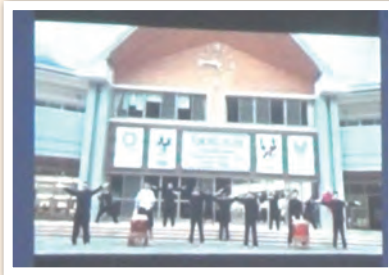
3年生～劇と団結をテーマに～