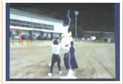
2年生～走と団結をテーマに～