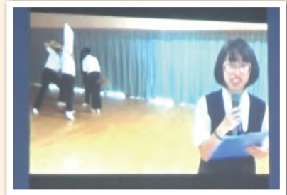
生徒会～総と団結をテーマに～