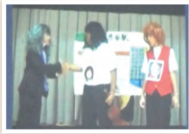
1年生～奏と団結をテーマに～