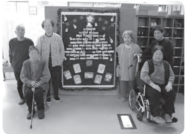
※撮影時のみマスクを外しています。