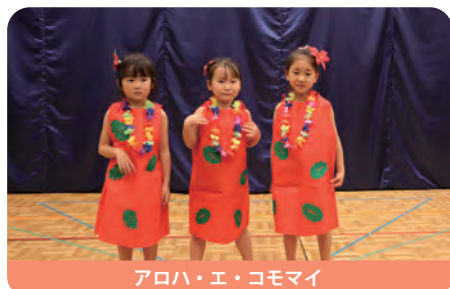
アロハ・エ・コモマイ

やまゆりセンターふれあいホールにて、お遊戯、舞踏劇を行いました。毎週行っているヒップホップダンスとフラダンスもかっこよく踊ることが出来ました。感染症でお休みのお子さんが多く少々残念でしたが、緊張した様子ながらも、練習の成果を十分に発揮することが出来ました。子ども達の姿に大きな成長を感じる事が出来た一日となりました。