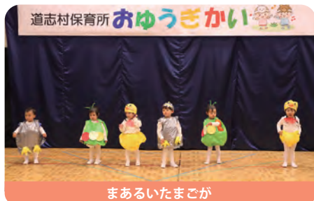
まあるいたまごが