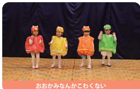
おおかみなんかこわくない