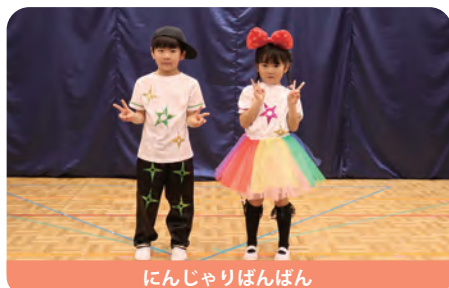
にんじやりばんばん