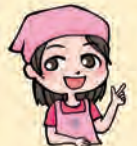
道志村食生活改善推進委員会 公式マスコットキャラ メイちゃん

「私たちの健康は、私たちの手で ～のばそう健康寿命・つなごう郷土の食～」をスローガンに、村内の食生活の改善や食育推進を目指して活動しています。ピンクのエプロンを目印に、様々な活動（こどもの料理教室、村内塩分調査訪問など）を通して地域の健康づくりを行っています。