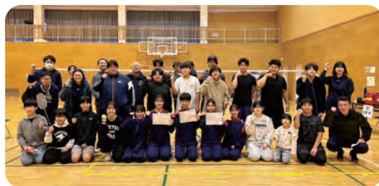
決勝トーナメント

最初に交流を目的としたダブルスでウォーミングアップをし、その後シングルのリーグ戦から決勝トーナメントまで一緒に汗を流し、応援しあう楽しい大会となりました。また、中学校バドミントン部の生徒や先生方には試合の運営にご協力いただきまして、ありがとうございました。