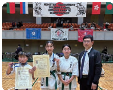
第1回モンスタートーナメント 国際硬式空手道選手権大会

11月2日（日）に平塚総合体育館で行われた第1回モンスタートーナメント国際硬式空手道選手権大会及び11月24日（月）に旧初狩小学校体育館で行われた大月市政71周年第23回大月市空手道選手権大会において円空会から参加した選手が輝かしい成績を収めました！