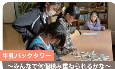
牛乳パックタワー