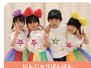
にんじやりばんばん

インフルエンザ流行のため上演できなかった、たんぼぼ組、ひまわり組の劇とダンスを、保護者の皆さんに披露しました。