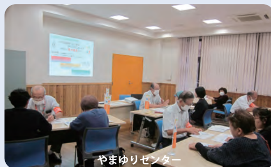
やまゆりセンター