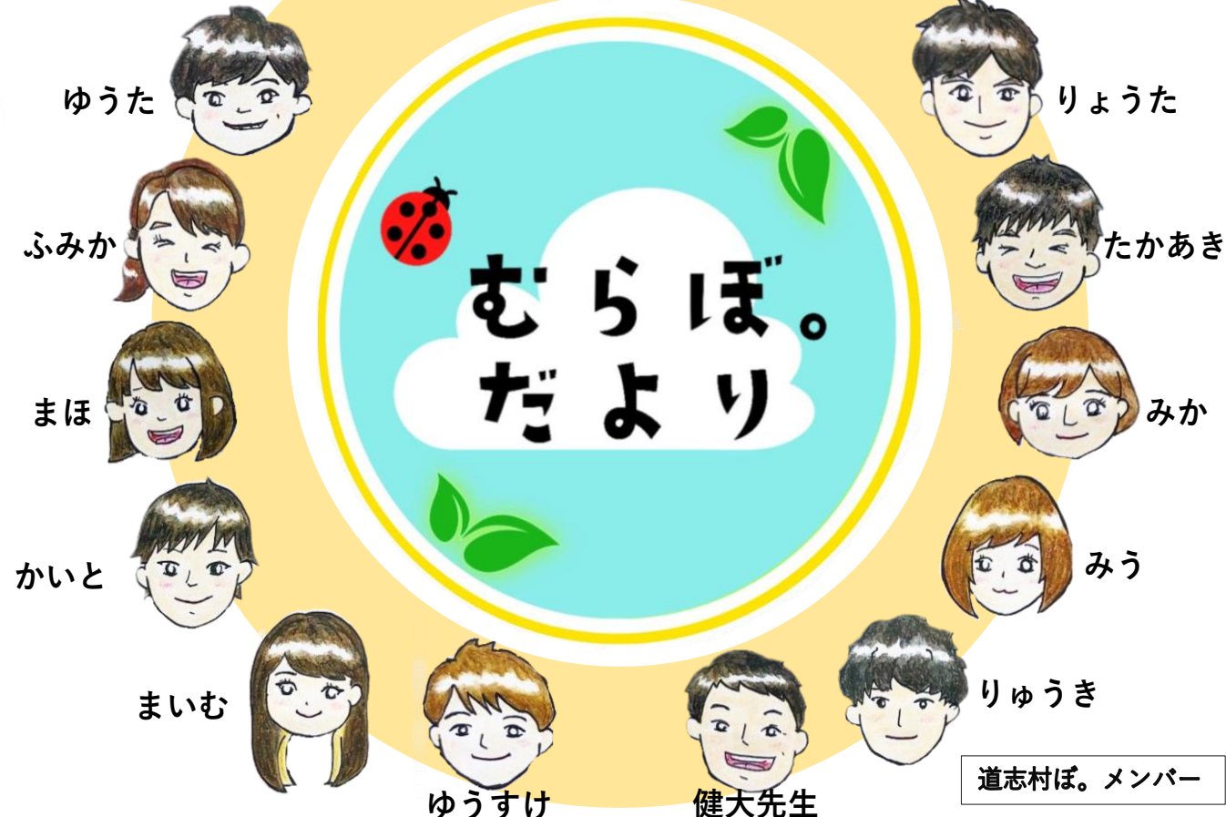
道志村ぽ。メンバー