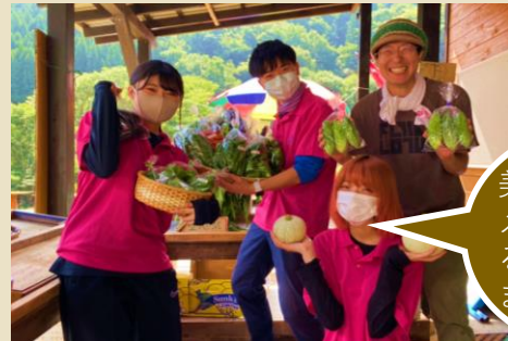
美味しいメニューを作るように頑張ります！