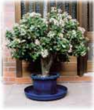
金のなる木 たくさんのお花が咲きました。