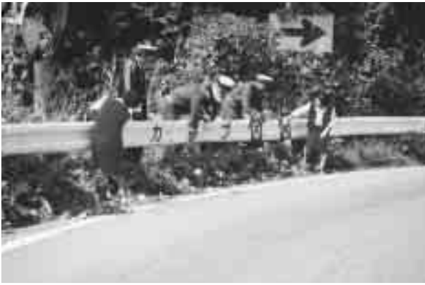
ガードレールにシートを設置（都留署と安協道志支部の方々）

また、都留署と都留交通安全協会道志支部の役員は八月に死亡事故が起きた急カーブなどの村内五ヶ所のガードレールに「急カーブ危険」と書かれたシートを張り付けて事故防止への推進を行う。