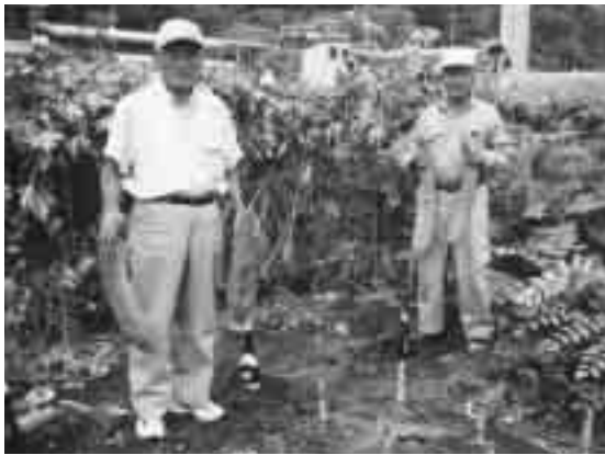
たくさんの大きなへちまを収穫