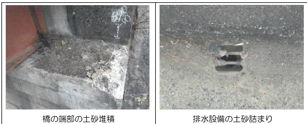
橋の端部の土砂堆積